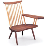
名前 ジョージ・ナカシマ