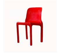
名前 ヴィコ・マジストレッティ 作品 セリーネ 特徴 FRP一体成型/スタッキング