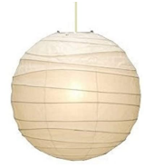
名前 イサム・ノグチ