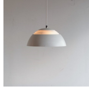
名前 アルネ・ヤコブセン 作品 AJロイヤル 特徴 シェードの上部にスリット