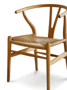
名前 ハンス・ウェグナー