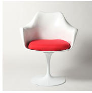
名前 エーロ・サーリネン