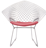
名前 ハリー・ベルトイア