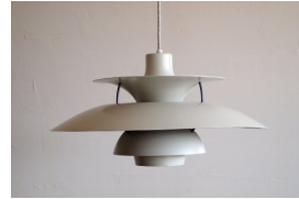
名前 ポール・ヘニングセン 作品 PH5 特徴 -