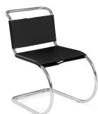
名前 ミース・ファン・デル・ローエ