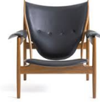
名前 フィン・ユール 作品 エジプシャンチェア 特徴 無垢材(ローズウッド)の削り出し・革