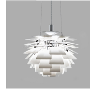
名前 ポール・ヘニングセン 作品 アーティチョーク 特徴 72枚の羽根の内側からの間接光