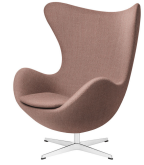
名前 アルネ・ヤコブセン 作品 エッグチェア 特徴 硬質発砲ウレタン/アルミダイキャスト