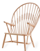
名前 ハンス・ウェグナー