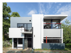
名前 ヘリット・トーマス・リートフェルト