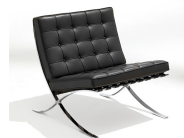
名前 ミース・ファン・デル・ローエ