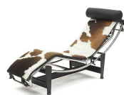
名前 ル・コルビュジェ