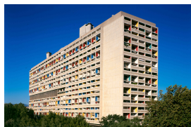
名前 ル・コルビュジェ