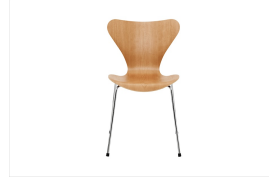
名前 アルネ・ヤコブセン 作品 セブンチェア 特徴 成形合板・スチールパイプ/スタッキング