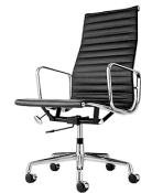
名前 チャールズ・イームズ 作品 アルミナムグループ 特徴 アルミ・革/リクライニング機能