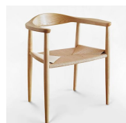
名前 ハンス・ウェグナー