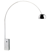
名前 アキーレ・カスティリオーニ 作品 アルコ 特徴 大理石の台座から伸びる金属製のアーム