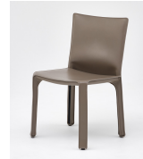
名前 マリオ・ベリーニ 作品 キャプチェア 特徴 スチールの骨組みに革のカバー