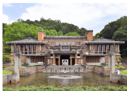
名前 フランク・ロイド・ライト