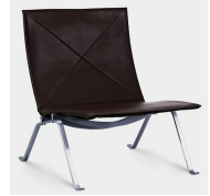
名前 ポール・ヘニングセン 作品 PK22 特徴 革・スチールバー