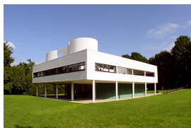
名前 ル・コルビュジェ