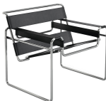
名前 マルセル・ブロイヤー